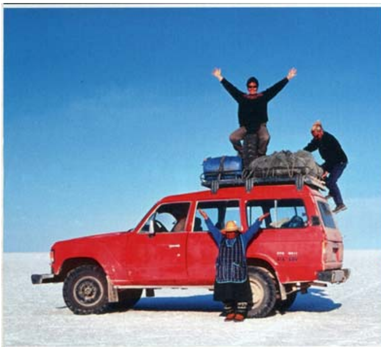
Sopra, l'autrice e due compagne di avventura nel Salar de Tunupa. A lato, un'offerta tra gli Yatiri, in Bolivia.

stimolare un rinnovamento e rimettere i nostri problemi in una giusta prospettiva frapponendo una distanza fra l'io di sempre e quello dell'altrove. In realtà, partire è per me sempre un piccolo, doloroso strappo ed è importante sapere di avere un luogo a cui tornare per poter riordinare emozioni e scoperte, appunti di viaggio e immagini. Altrimenti rischierei un accumulo sterile e incapace di trasformarsi in "vita vera", che è inevitabilmente soprattutto quella della nostra quotidianità. Nel capitolo intitolato N come Nostalgia parlo proprio del mio essere un po' nomade e un po' stanziale, perché di queste due cose sono fatta, andare e ritornare, proprio come le rondini che ancora nidificano sotto i tetti della fattoria del nonno, dove vivo...».